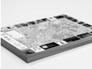
GÖTEBORGS OFFICIELLA RIV-AV-KARTA