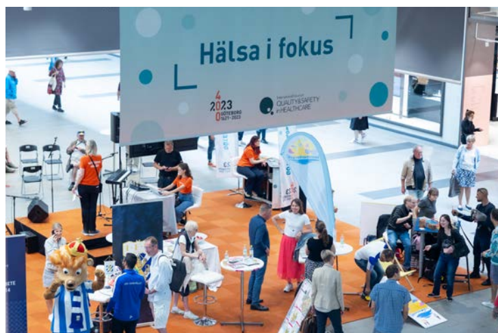
Hälsan stod i fokus när Göteborgs 400-årsjubileum arrangerade en pop-up arena i Nordstan.