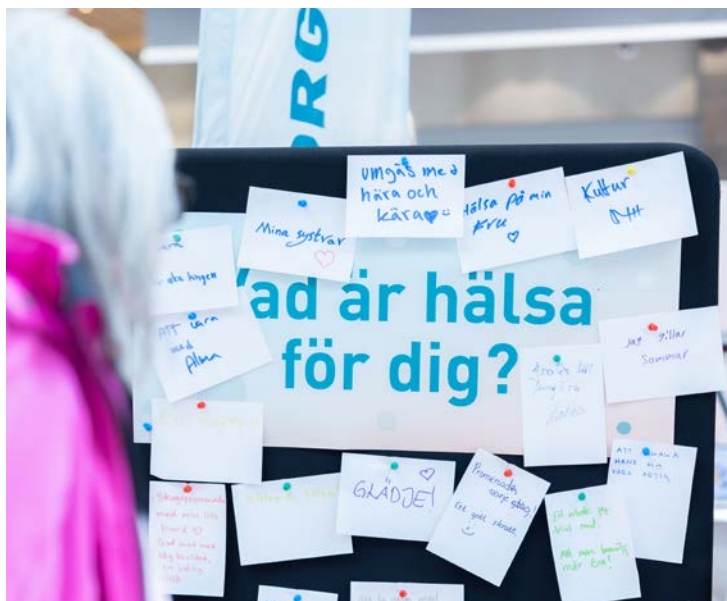
Överst och mitten: Pop-up arenan i Nordstan lockade stora som små.