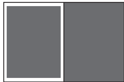
Helsida, 132×184 mm Utfallande helsida, 145×210 mm

Besökare till Göteborg; turister, mäss-/kongressbesökare, studenter, affärsresenärer med flera.