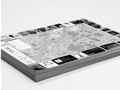
GÖTEBORGS OFFICIELLA RIV-AV-KARTA